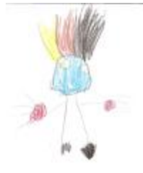
Príncipe guapo, por Carmen M.

Y, dicho y hecho, el príncipe ya no es azul y todos están contentos. a todo esto, por allí pasó la ratita presumida belén, que, al ver al príncipe en el andén, asobradá se quedó.