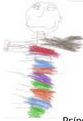
Príncipe contento, por Paula G..

Y, dicho y hecho, el príncipe ya no es azul y todos están contentos. a todo esto, por allí pasó la ratita presumida belén, que, al ver al príncipe en el andén, asobradá se quedó.