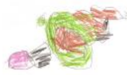
Mariquita y mariposa, por Ignacio.